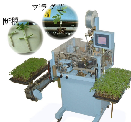
カム駆動による高速コンパクト自動機の製作